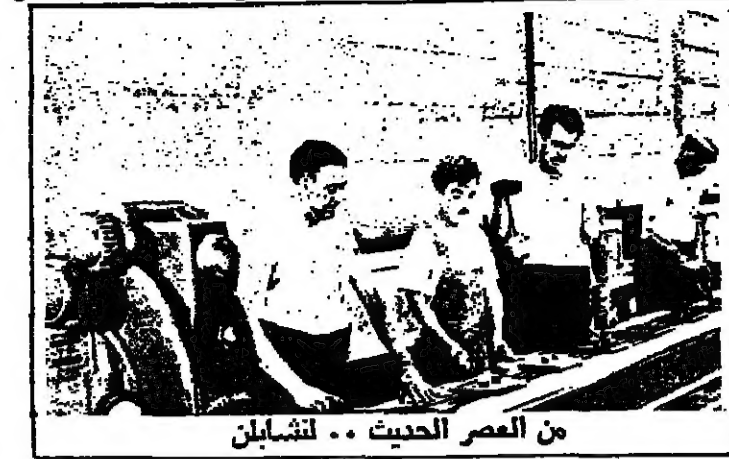
من العصر الحديث .. لتشابان

روايات هامة من روايات الخيال العلمي التي كتبها كتاب شهيرين من امثال جورج بوليس « ٢٠ الف فرسخ تحت الماء » او « ٢٠ الف فرسخ تحت الارض » او